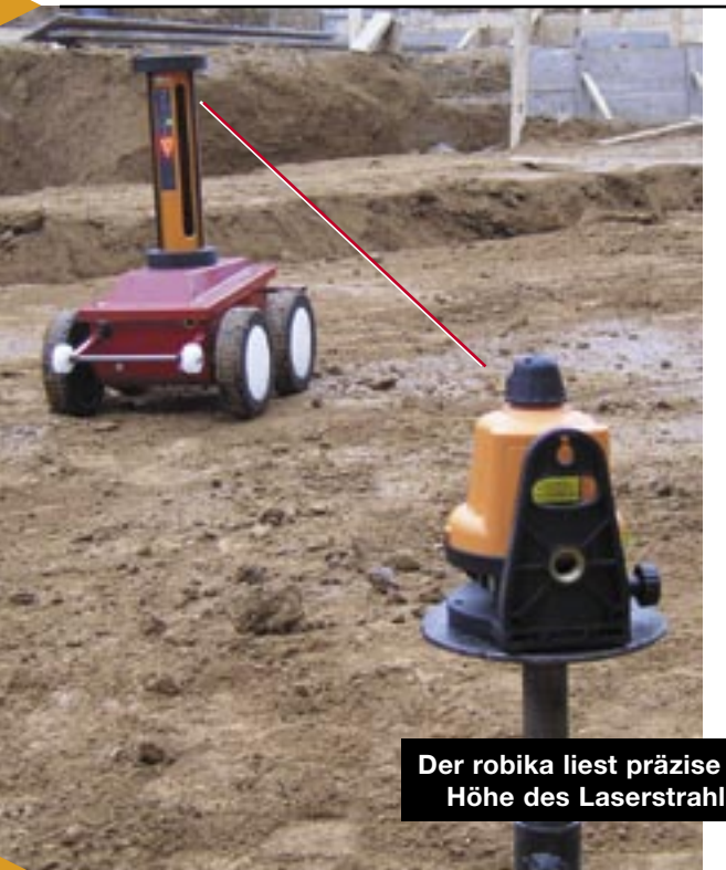
Der robika liest präzise die Höhe des Laserstrahls