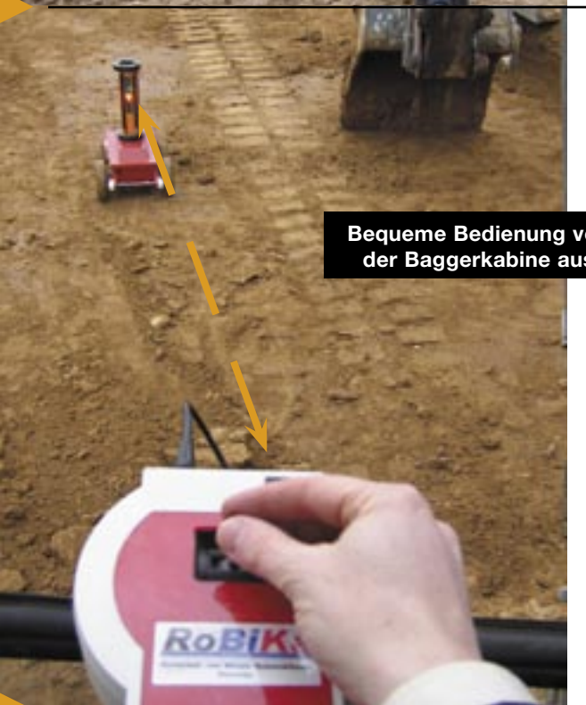
Bequeme Bedienung von der Baggerkabine aus